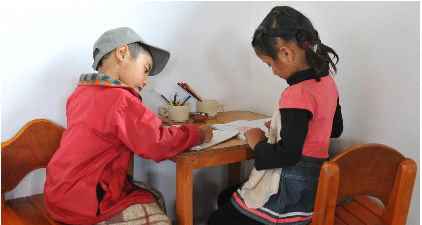
Selbstständig und gemeinsam Lernen im Montessori Zentrum. (Bhandar, Ramechhap, 2022)

(Bhandar, Nepal, Status und Fortschrittsbericht, Mai 2023)