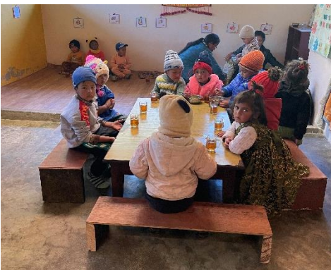
Im Speisesaal werden die Kinder gut gepflegt. (2022)