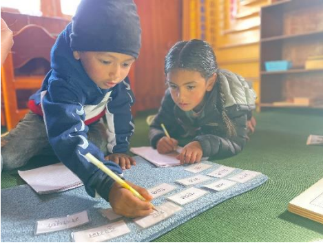
Gemeinsam macht Lernen viel mehr Spaß! (2022)