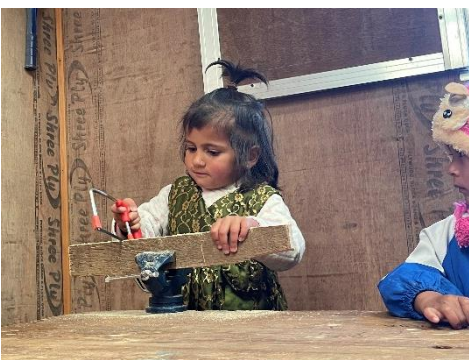
In der Werkstatt des Montessori Zentrums können sich die Kinder handwerklich austoben. (2022)

mit ein. Sie haben Entscheidungsräume und Stimmrecht. Gemeinsam getroffene Beschlüsse werden umgesetzt und respektiert. So werden die Kinder dabei unterstützt, Unabhängigkeit und Selbstbewusstsein zu entwickeln.