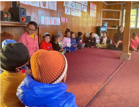
Ritual – der Morgenkreis gehört zum festen Tagesablauf der Kinder. (2022)