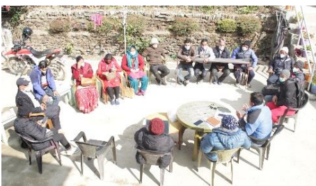
Die Jungunternehmergruppen sind eine große Unterstützung.