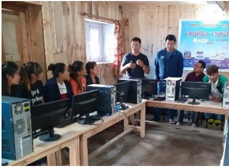
Die modernen Ausbildungsberufe sind bei jungen Männern und Frauen gleichermaßen beliebt.