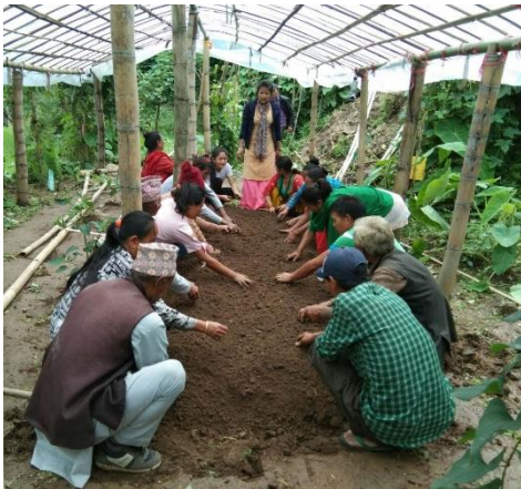
Praktisch lernt es sich am besten.