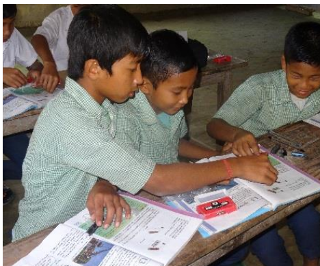
Anschaulicher Physikunterricht (Assam, 2017).

Breitenwirkung erzielen: Nach erfolgreichen Pilotprojekten an 200 staatlichen Schulen in Assam, Nepal und Nordbangladesch mit unterschiedlichen Partnern skalieren wir nun die Programme und wollen in den nächsten Jahren zehntausenden Schülern zu einer besseren Bildung verhelfen. Neben Nordostindien stehen dabei Nepal, Nordbangladesch und Myanmar im Fokus.