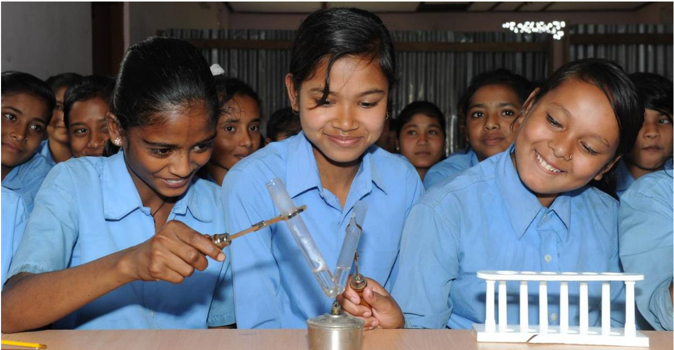
Naturwissenschaft zum Begreifen – Experimente im Unterricht machen Spass und verbessern den Lernerfolg (Assam, März 2017).

(Projektstatus und Fortschrittsbericht, Oktober 2018)