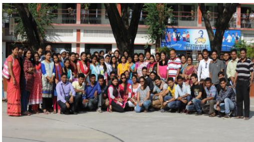
Fortbildung, persönliche Begleitung und Förderung von Lehrern ist der Schlüssel für Schulerfolg (Kokrajhar 2016).

Childaid Network - Bildung bewirkt Transformation: In 10 Jahren haben wir mit unseren Partnern mehr als 120.000 jungen Menschen, die nie zur Schule gehen konnten, Zugang zu Grundbildung oder beruflicher Qualifizierung ermöglicht. Straßenkinder, ethnische Minderheiten, Flüchtlinge, Behinderte und Schulabbrecher lernten lesen und rechnen. In unseren Brückenkursen und Abendschulen, durch Nachhilfe oder bei Handwerkskursen erwarben sie gleichzeitig Selbstvertrauen und die Grundlage für eigene Einkünfte.