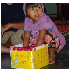
Frühkindliche Erziehung ist wichtig für Talententfaltung (Tamenglong, 2017).

Bildung ist Gesellschaftsaufgabe: Unsere Partner initiieren Dorfräte, die helfen, auf die Qualität des Unterrichts zu achten. In regelmäßigen Treffen werden die Mitglieder trainiert und darin unterstützt, Schulentwicklungspläne aufzustellen und staatliche Gelder dafür zu beantragen.