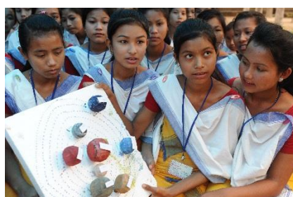
Gute Lernmaterialien und Projektarbeit erhöhen den Lernerfolg (Assam, 2017).