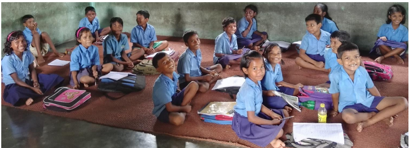
Es braucht nicht immer großartige Gebäude: Schule kann auch so Spaß machen und effektiv sein! (Assam, 2017)