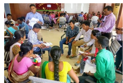
Lehrerfortbildung fördert die Motivation und Qualität des Unterrichts (Assam, 2018).