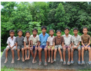
Dienstags am Straßenrand, für diese Jungen findet Schule nicht statt (Arunachal Pradesh).

Armenhaus Nordostindien: Die sieben Schwesterstaaten Nordostindiens, zusammen so groß wie die alten Bundesländer, sind eine der ärmsten Regionen der Welt. Schwer erreichbar, kaum erschlossen und gefährdet durch Naturkatastrophen und ethnische Konflikte lebt die große Mehrheit der 45 Millionen Einwohner unter der Armutsgrenze von einem Euro pro Tag. In den Bergen erleben vier von zehn Kindern den fünften Geburtstag nicht. 90% der Erwachsenen sind dort Analphabeten – und auch für die nachwachsende Generation ist guter Unterricht zumeist ein unbekannter Luxus.