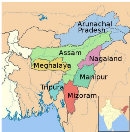
Sieben Schwesterstaaten bilden Nordostindien, östlich von Bangladesch