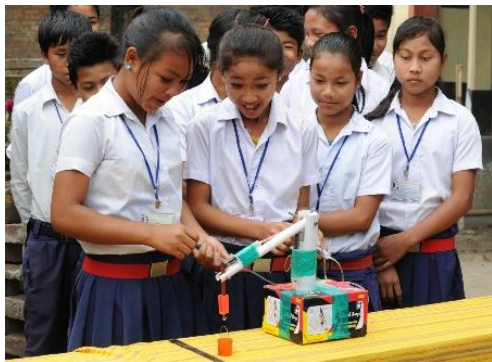
Das bleibt in Erinnerung: Ein Hydraulikkran gemeinsam entwickelt und erprobt (Assam, Frühjahr 2018).