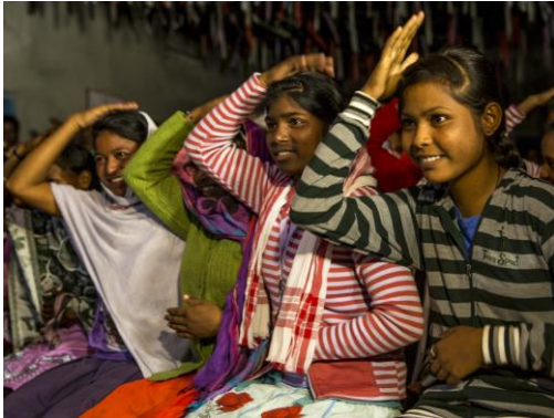
Eine zweite Chance: In Abendschulen holen tausende Jugendliche Grundbildung nach (Chirang, 2015).